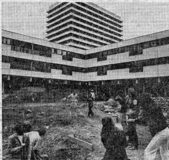
Den unge kunstnergruppe graver ud til søen, der får andeø og bro. I baggrunden ses Peder Lykke Centrets kollektivhus. (Foto: Kurt Nielsen).

da han fik de unges ide at se. De udstyrer haven med kunstig sø, ægte kolonihavehus, med et bro-anlæg og med 6-7 meter høje træer anbragt i forskellige niveau, så patienterne også kan bruge gården som et træningsområde.